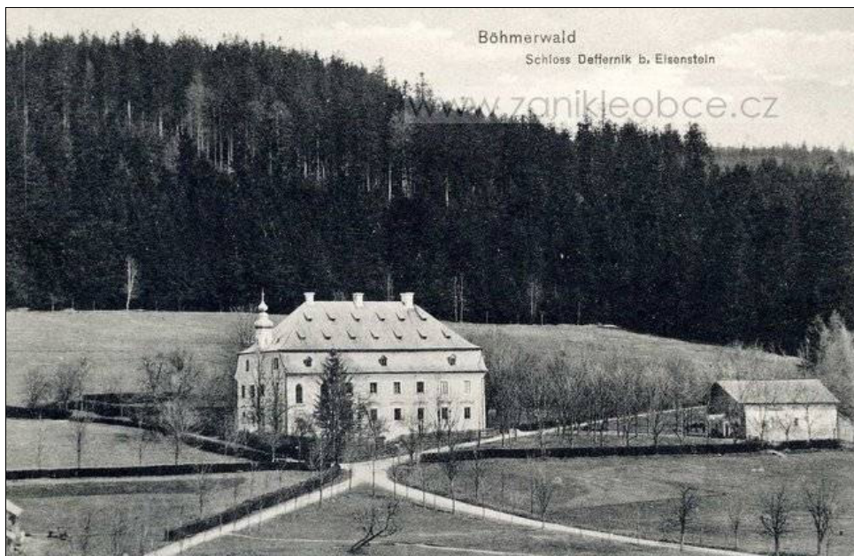
Historická fotografie dominikální plužiny Debrníku, jejímž jádrem byl zámek

Dominikální plužiny se v řešeném území vyskytovaly pouze okrajově. Jejich tvůrcem zde také nebyla vrchnost (jak je obecně pravidlem), ale bohatí majitelé skláren.