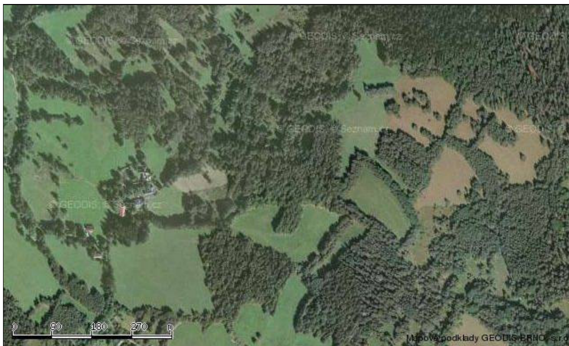
Částečně již zarostlá úseková plužina Malého Kozího Hřbetu

Některé úseky v rámci úsekových plužin bývají pravidelně členěny na převážně užší pásy. K tomuto vnitřnímu členění úseků zpravidla docházelo až druhotně. Tyto dělené úseky však zpravidla nevytvářejí samostatné plužiny, ale jsou smíšeny s nečleněnými úseky. U soustředěných lánových vsí pak zpravidla obsazují okrajové části katastru. Časté je záhumenicové uspořádání dělených úseků v návaznosti na sídlo. Pruh pozemku zde přímo navazuje na usedlost, k níž náleží. Poměrně běžné byly i přechodné formy mezi lánovou a dělenou úsekovou plužinou, kdy na domy navazovaly výrazné lánové pruhy, zbylá část plužiny však měla charakter dělených úseků. Významný druhotný růst zastoupení úsekových, a zejména dělených úsekových plužin, byl způsoben pozdější parcelací původně společně obhospodařovaných pastvin a luk.