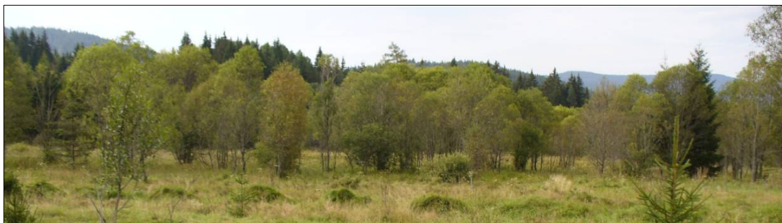
Zarůstání plužiny zaniklých Radvanovic