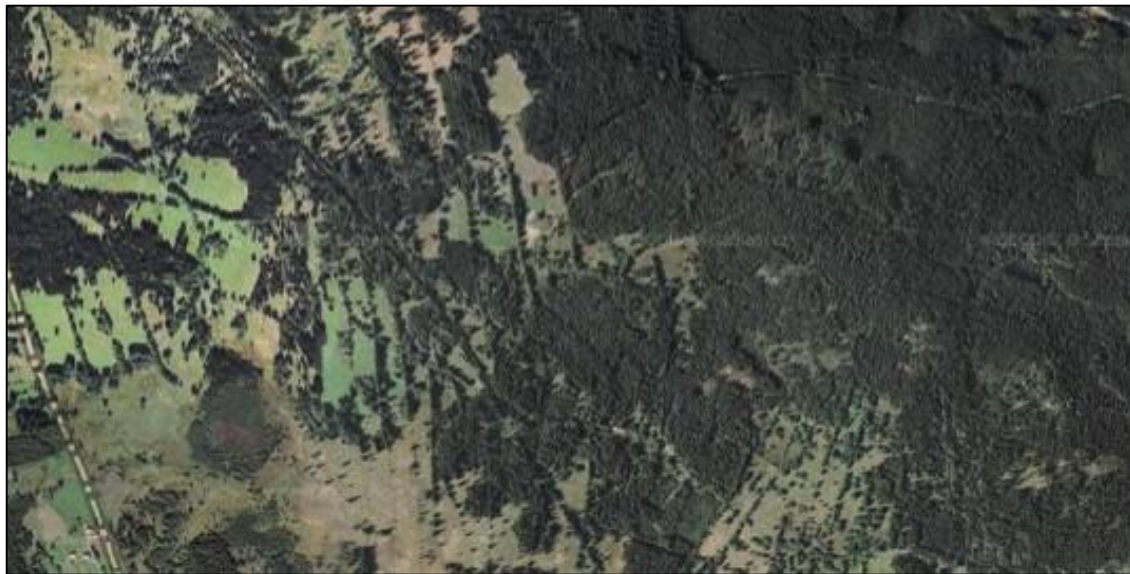
V minulosti zemědělské, dnes zalesněné či zarůstající krajiny u Filipovy Hutě a na Krásné Hoře