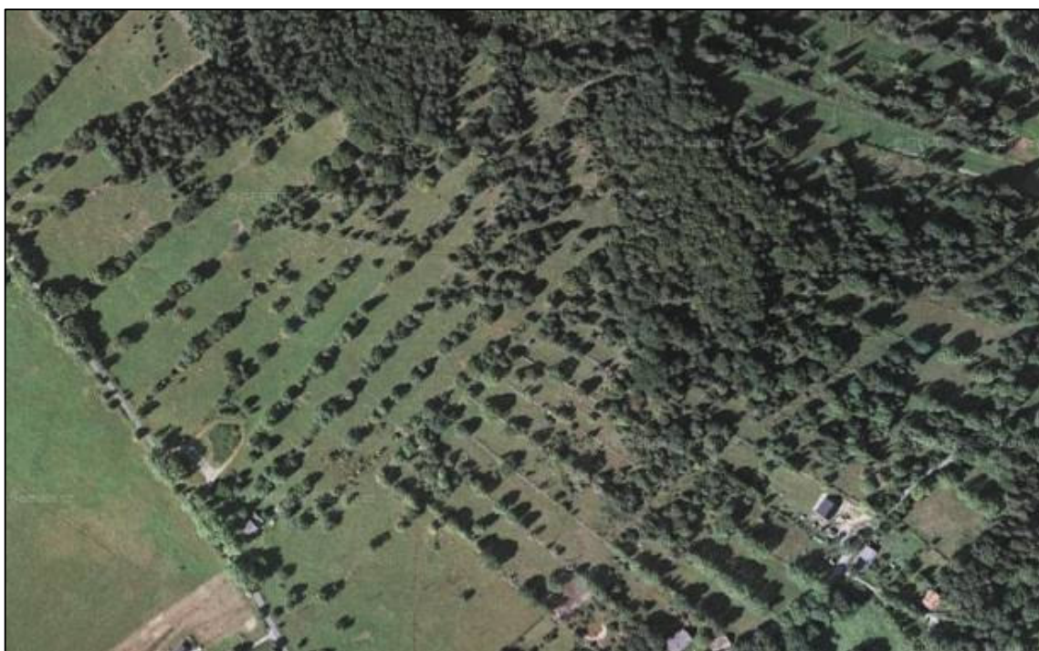
Plužina dělených úseků u Českých Žlebů