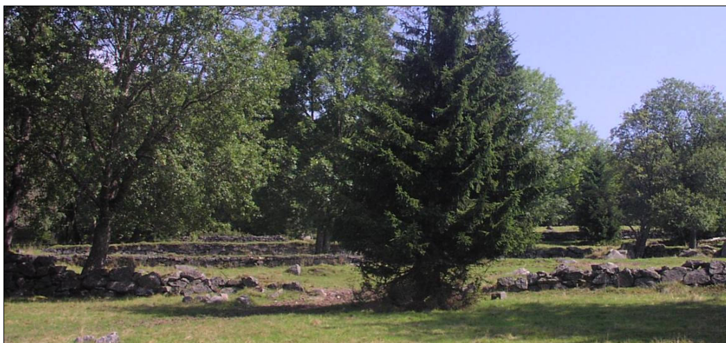
Výjimečně dochované, dnes však narušované kamenice, zídky a tarasy, na bývalé Světlé Hoře