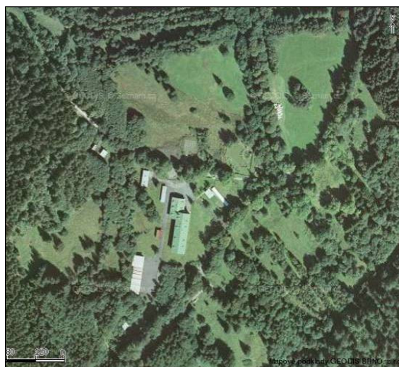
Dominikální plužina Debrníku v roce 1949 a její pozůstatky v roce 2008

Významná část plužin byla, tak jako na naprosté většině území České republiky, scelená do velkých lánů. Historická struktura uspořádání pozemků byla na těchto plochách zcela setřena. De facto se tak jedná o zcela nový typ - plužina scelených lánů .