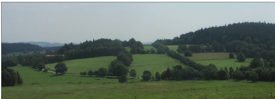
Úšeková plužina na Dolní Zvonkové