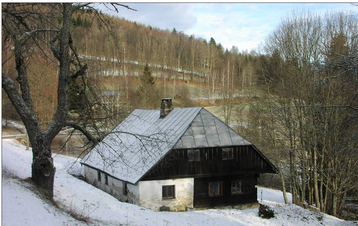
Úseková plužina s rozptýleným osídlením z Údolí u Srní

Lánová plužina – začala vznikat až po přechodu k individuálním formám hospodaření. Lokálně se tyto plužiny objevují již ve vrcholném středověku. Charakteristické jsou však pro krajinu pozdně středověké kolonizace. Na Šumavě se typicky uplatňovaly až v pozdním novověku. Lánové plužiny vznikaly výhradně společně s lánovými vesnicemi, většinou podél vodního toku, zde však výhradně podél komunikace, kdy se v určitých rozstupech stavěly domy. Jejich vzdálenost byla dána šířkami pozemkových pruhů, v němž každý dům stál. Každý pruh vlastnický náležel k danému domu a záhumentní uspořádání pozemků zde tedy bylo pravidlem. Jednotlivé pásy se táhly napříč celým katastrem. Kromě hlavních komunikací spojujících vesnice, vedly polní cesty po hranicích pozemků do jednotlivých statků, podél nich vznikaly i kamenice. Ty vzhledem ke kamenitosti zdejší půdy byly mnohdy velmi mohutné a samy o sobě tak tvoří dosud typický znak šumavské krajiny.