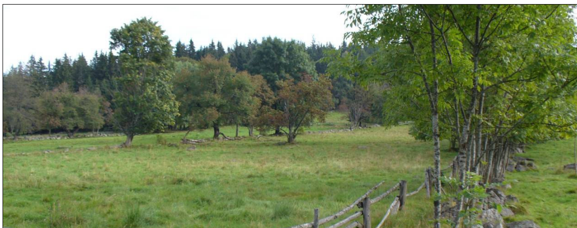
Plužina dělených úseků u Českých Žlebů

Úseková plužina s rozptýleným osídlením – je na území národního parku i celé České republiky vývojově nejmladším typem. Na Šumavě se uplatňovala až v poslední kolonizační vlně, jež osazovala nejvyšší partie. Tam byla v minulosti hojně zastoupena. Tyto polohy však nejvíce postihla poválečná redukce osídlení a dnes se tedy vyskytuje pouze na několika málo enklávách.