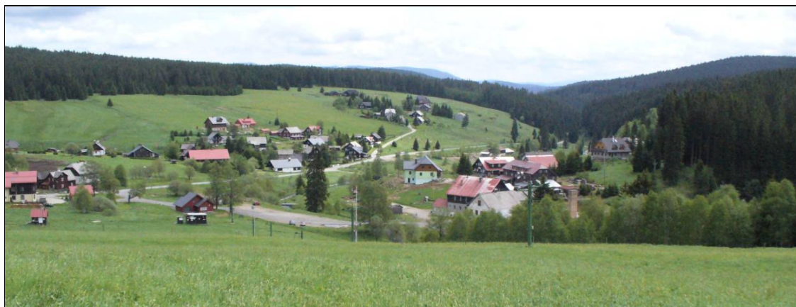
Kulturní krajina v okolí Kvildy

Není nutné zachovat bezlesí v jeho historickém nebo současném rozsahu. Jeho dílčí redukce je v zásadě možná, nesmí však dojít k narušení tradičního charakteru krajiny.