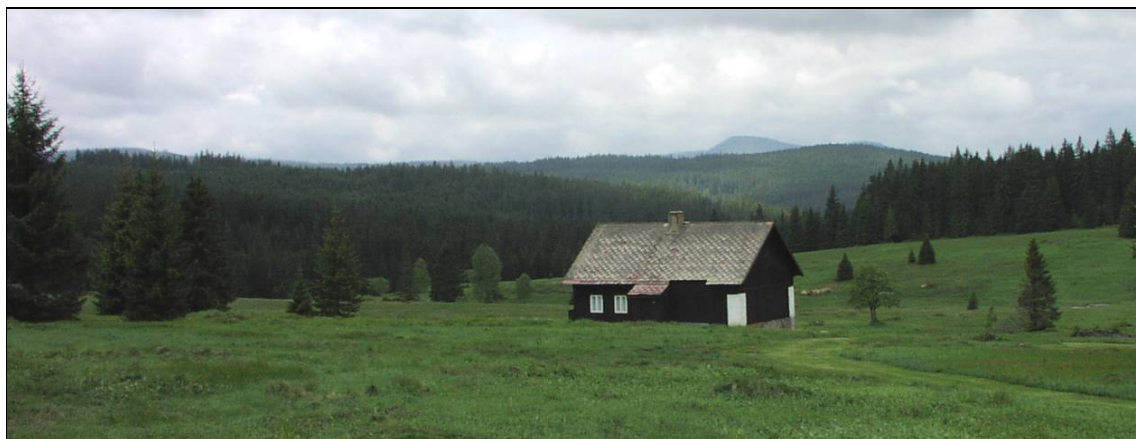
Pohledově otevřená sídelní enkláva Filipovy Hutě.

V enklávách, jež jsou charakteristické pohledovou spojitostí nebo se v nich rozptýlená zeleň uplatňuje pouze ve formě solitérů a linií, nedopustit vznik souvislých náletových ploch.