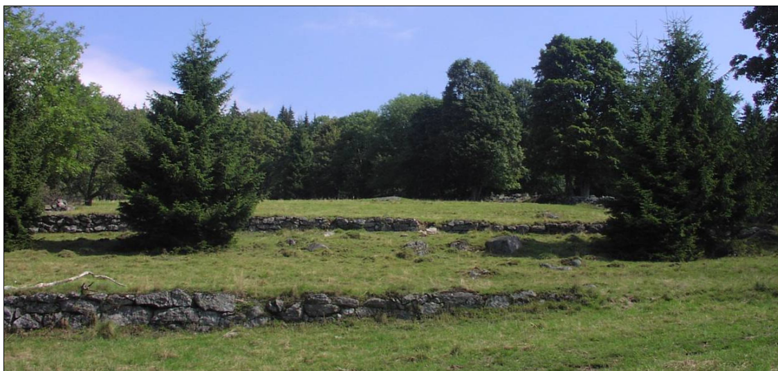
„Opuštěná krajina“ na Světlé Hoře