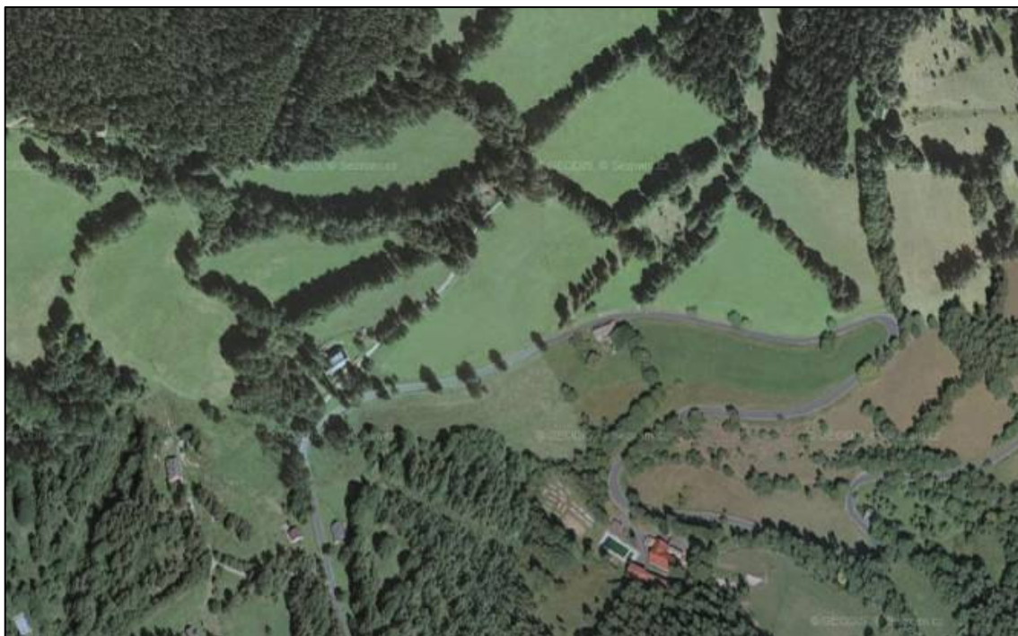
Úseková plužina s rozptýleným osídlením Údolí u Srní

Tento typ je charakteristický absencí soustředěného sídla jako přirozeného jádra plužiny. Jednotlivé usedlosti jsou rozptýleny po ploše enklávy a jsou tedy součástí plužiny. Každá usedlost zpravidla stojí uprostřed nebo na okraji úseků, které k němu náleží.