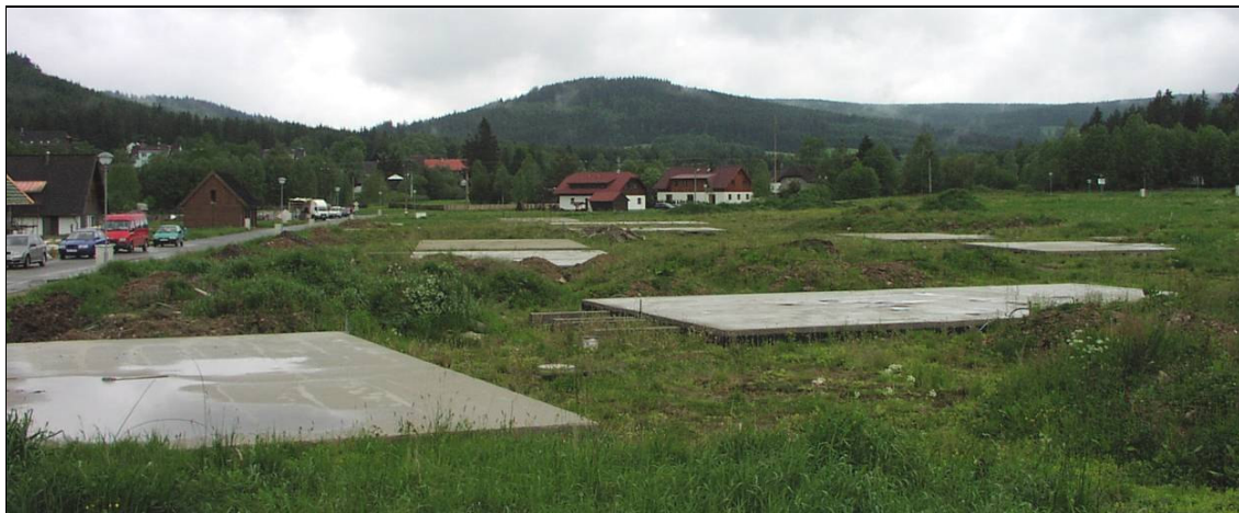
Plošné zastavování krajiny v Borových Ladech