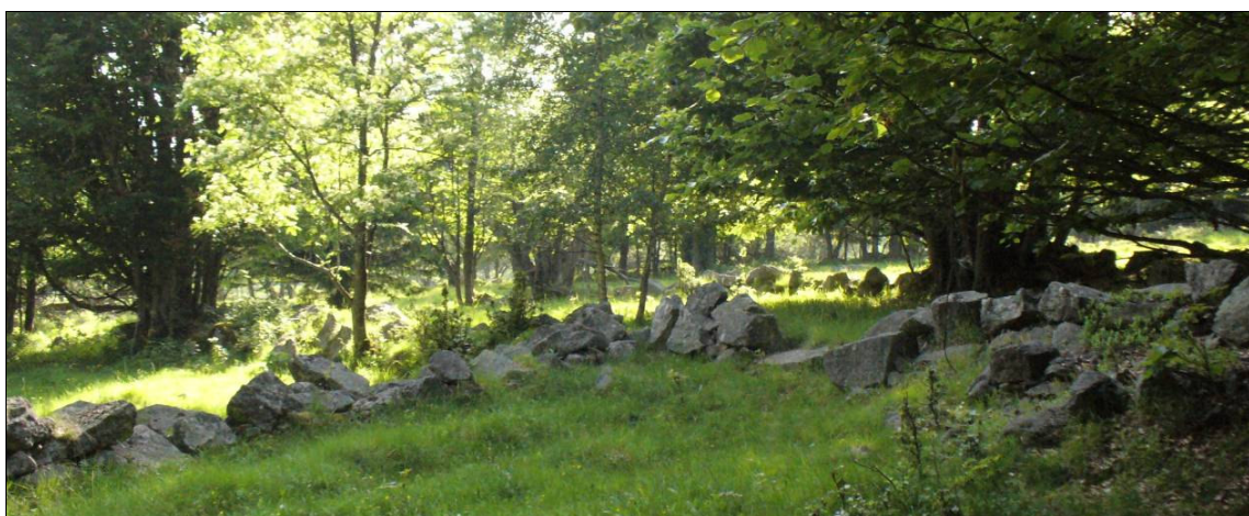
Plužina dělených úseků u Českých Žlebů