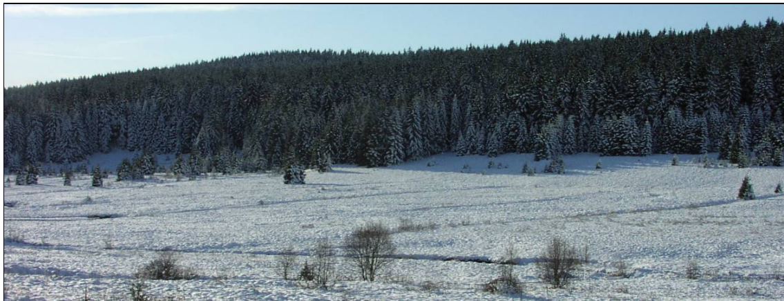
Údolí Křemelné v plužině zaniklého Zhůří

Tyto segmenty je žádoucí zachovat v jejich pohledově otevřeném charakteru pouze se solitéry a malými skupinkami dřevin. Ohraničení jednotlivých úseků je zde tvořeno malými vodními příkopy. Ty je taktéž žádoucí zachovat – nepřehrazovat.