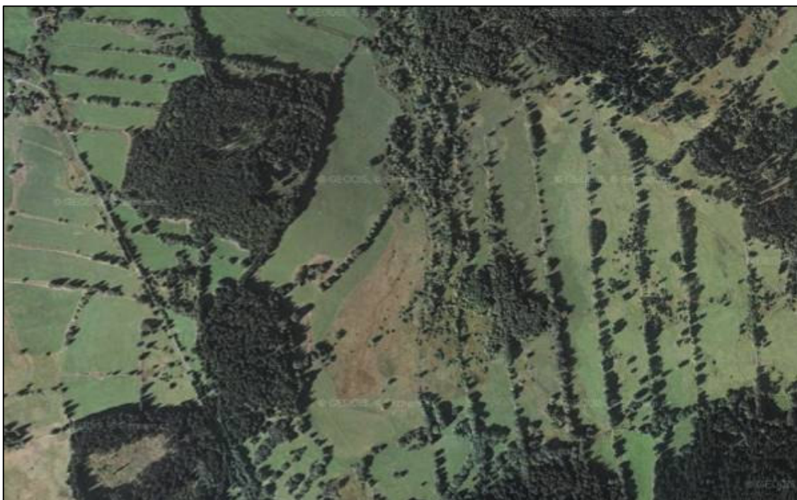
Lánová plužina zaniklých vsí Horního a Dolního Cazova