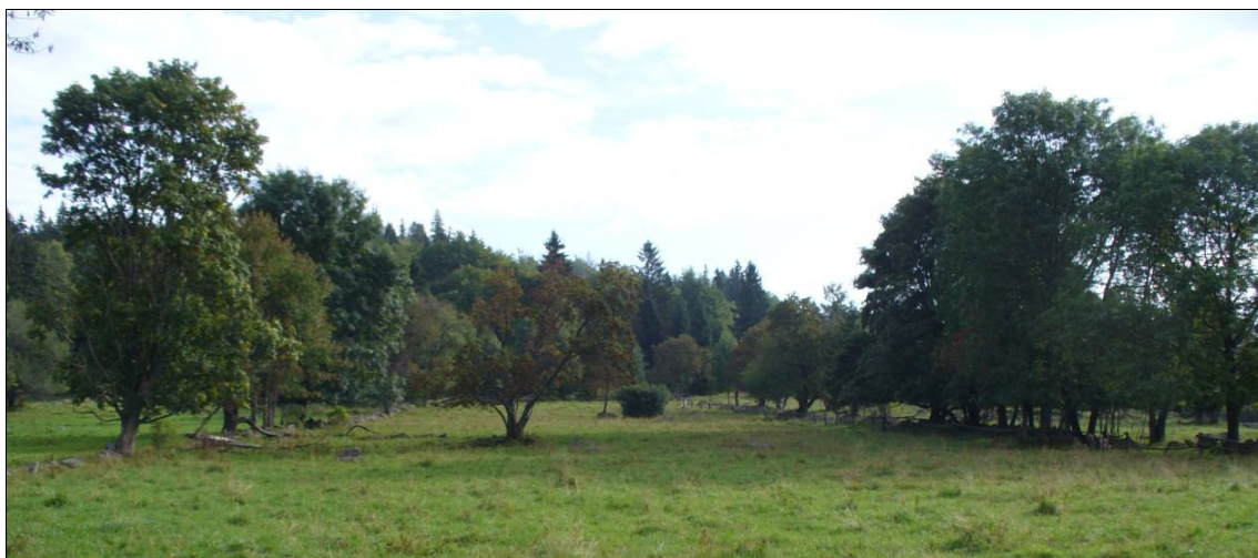
Zřetelné pásové uspořádání plužiny u Českých Žlebů