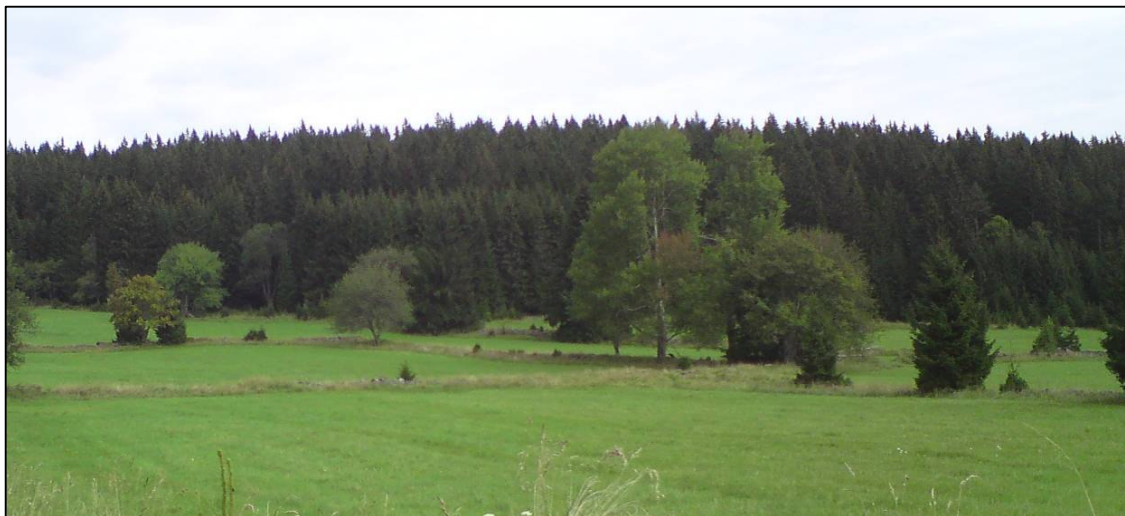
Výjimečně dochovaná plužina bývalé Nové Polky

Jedná se zejména o segmenty: Zadní Zvonkové, Jelení, Českých Žlebů, Dobré, Mlaky, Krásné Hory, Kamenné Hlavy, Dolního a Horního Cazova, Světlé Hory, Nové Polky, Březových Lad, Knížecích Plání, Stodůlek, Bučiny, Orla (nad Kvildou), Kozích Hřbetů, Údolí a Dolní Zelené Hory u Srní a Zhůří pod Hadím vrchem.