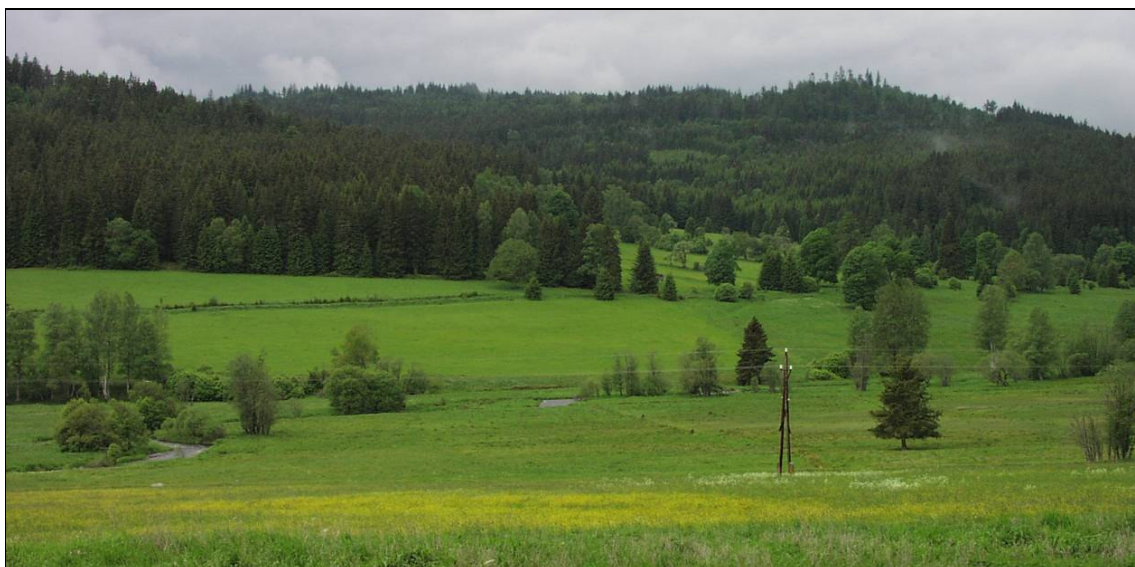
Údolí Teplé Vltavy u zaniklých Březových Lad

Zabránit ztrátě toto specifického typu krajiny, ať už zarůstáním nebo obnovením zástavby. V případě, že se jedná o segmenty s dochovanou historickou strukturou plužin, postupovat podle výše uvedených zásad. V případech, kdy byla enkláva osazena soustředěnou vsí, kterou dnes upomíná pouze skupina vzrostlé zeleně, je nejvhodnější zachovat tento stav, kdy je zaniknuvší sídlo v krajině – podle vzrostlé zeleně - dobře identifikovatelné. Nedopustit tedy v plužině takový rozvoj rozptýlené zeleně, který by tento charakter narušil.