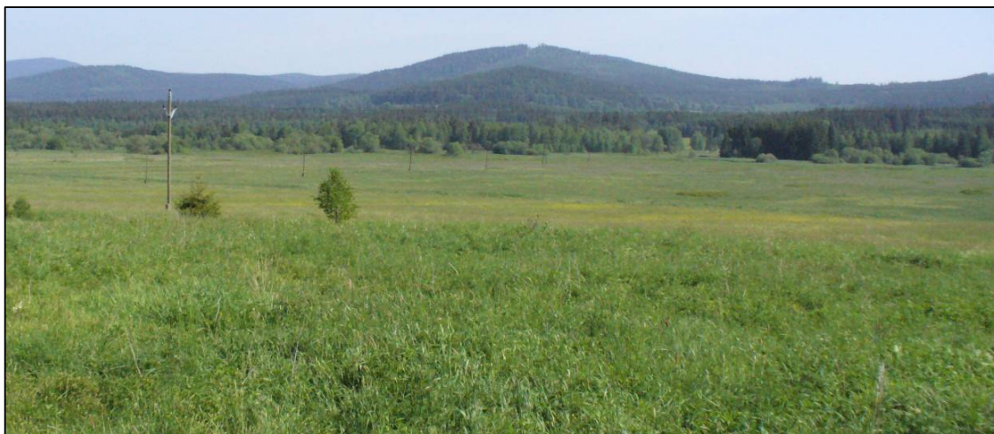
Scelená plužina u Dobré

Velkoplošné obhospodařování pozemků souviselo se socializací zemědělství v druhé polovině 20. století a narušilo značnou část plužin národního parku. Dnes již, alespoň předpokládáme, tento trend nehrozí.