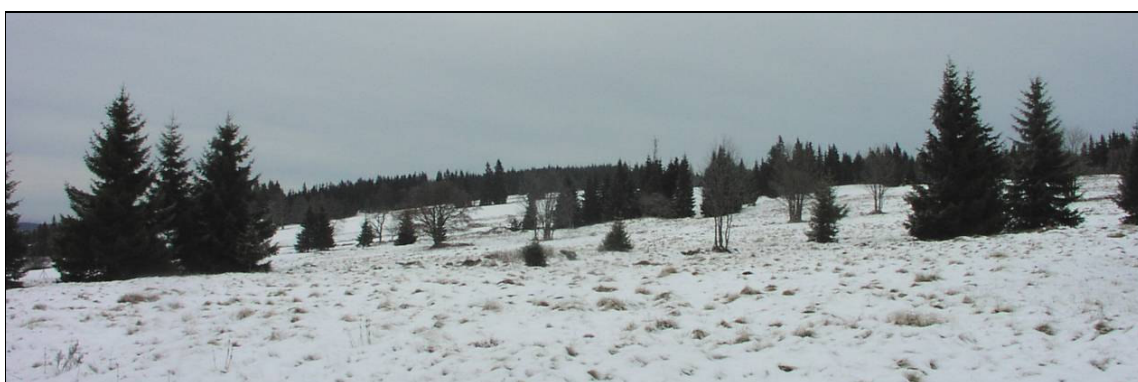
Plužina s nezřetelnou historickou strukturou v zaniklém Zhůří