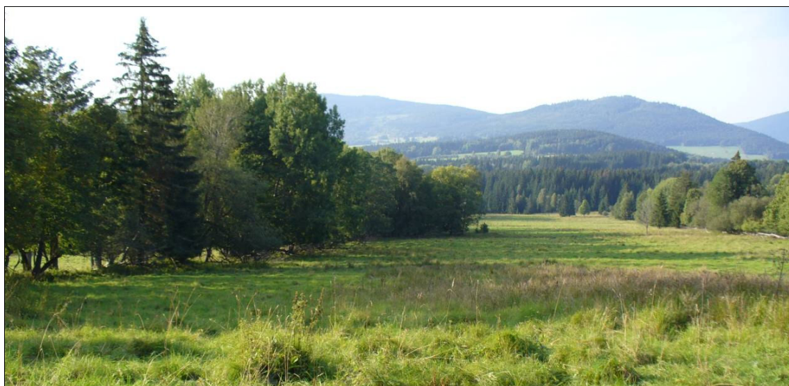
Široké pozemkové pásy lánové plužiny zaniklého Horního Cazova.