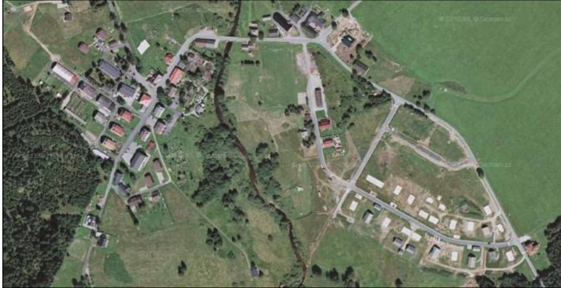
Borová Lada – rozšiřování zástavby

Atraktivnost krajiny NP Šumava přinesla zejména rozvoj rekreace, což je spojeno s výstavbou objektů různého charakteru. První náznaky se objevily již v druhé polovině 20. století, v posledním desetiletí však tento trend značně zesílil a lokálně může znamenat velké nebezpečí z hlediska zachování hodnot krajiny.