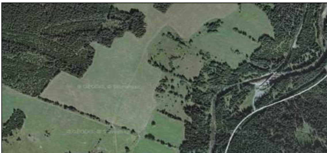
Částečně scelená plužina ve Vchyniči-Tetově

V případech, kdy je žádoucí obnovit narušenou historickou strukturu plužin (např. je-li segment v logické návaznosti na dochovanou strukturu nebo navazuje-li bezprostředně na velmi dochované sídlo), je nejvhodnější provádět obnovu pouze symbolicky: úzký pruh obnovovaného ohraničení jednotlivých pozemků (cca půlmetrové šíře) vymezit a ponechat spontánnímu vývoji. V obhospodařované plužině bude neudržovaný pás dostatečně zřetelný a postupem času jeho zřetelnost ještě vzroste spontánním náletem dřevin. Je nežádoucí jakkoliv uměle obnovovat zaniklé formy historického ohraničení (např. kamenice).