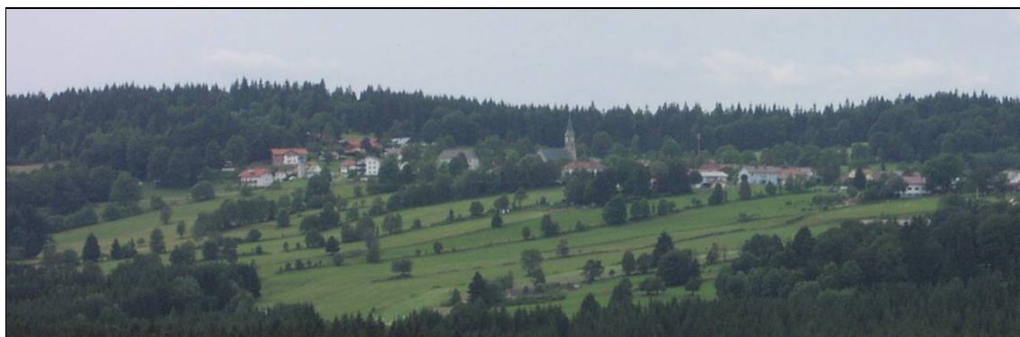
Lánová plužina v přeshraničním Bischofreutu