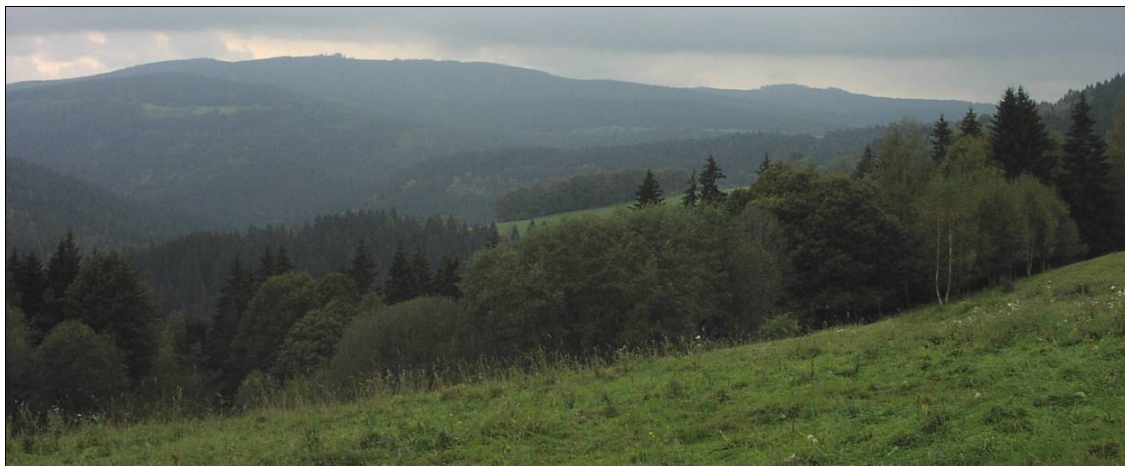
Atraktivní rozhledy z malé enklávy Přední Paště.

Nové Údolí, Orel (nad Kvildou), Výhledy, Horní Antýgl a Zlatá Studna u Horské Kvildy, Podlesí, Zhůří (pod Hut'skou horou), Vysoká Mýt', Březník, Vchynice-Tetov, Zadní a Přední Paště, Babylon, Velký Bor, část. Stodůlky, Větrný (S od Prášílského jezera), Skelná, Rovina, Horní Žďánidla nebo Pomezí, Formberg a Hůrka, Rybárna, Javoří Pila, Schwartzův statek.